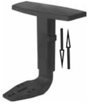
FRITZ Regolabile / adjustable