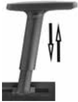
GINGER 1D Regolabile / adjustable