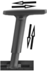
GINGER 2D regolabile / adjustable