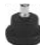
Piedini / glides