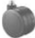
3 Ruote ø 60 nylon Nylon ø 60 castor