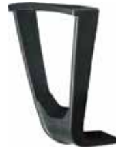
TEKNO Fisso / fixed