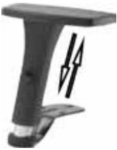
FRED 1D regolabile / adjustable