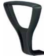
GOLF Fisso / fixed