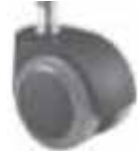
5 Ruote frenate ø 50 gommate Rubber ø 50 braked castor