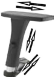
BRAD 3D regolabile / adjustable