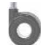
8 Ruote ø 60 gommate forate Rubber ø 60 drilled castor