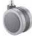
4 Ruote ø 60 gommate Rubber ø 60 castor