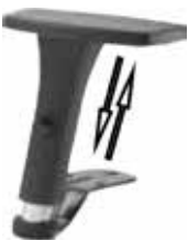
FRED 1D regolabile / adjustable